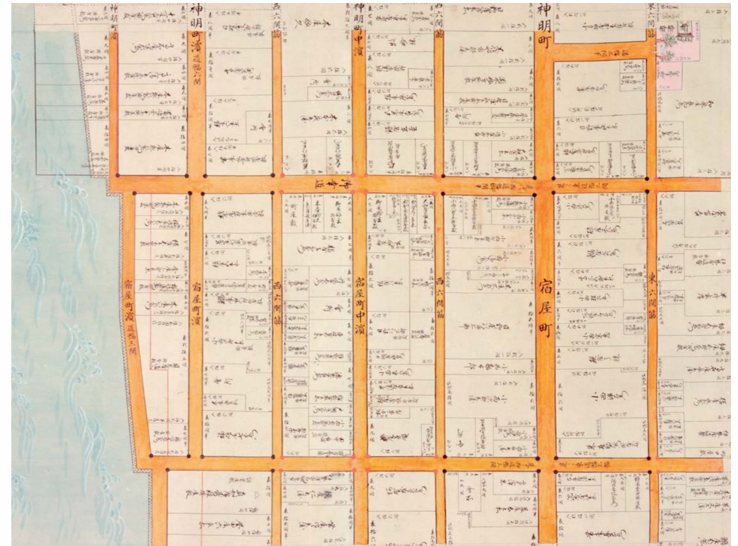
「元禄堺大絵図模写本」【部分】(堺市博物館蔵)

今号の表紙 今号の表紙も、「元禄堺大絵図」模写本で、前号(27号)の表紙の地図の南西に位置する部分です。ちょうど、前号の地図の南西の端と今号の地図の北東の端が接しています。まさしく、その接点に位置するのが、「神明宮」「神明社」と呼ばれるもので、敷地は寺社の色分けのピンク色に塗られています。今は影も形もありませんが、神明町の町名の元になったともいわれています。今回の絵図は、北から現在の神明町、宿屋町、材木町の一部です。東六間筋から大道筋を越えて当時の西の海岸線までが入っています。海には波形が表現され、岸は石垣で固められています。現在とは違い、海がすぐ近くにあったことがわかります。