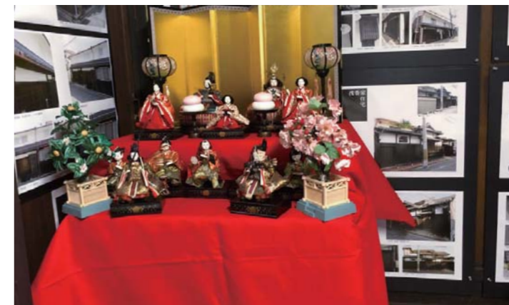
堺町家案内所のひな飾りの一部

今年は毎週木曜日の公開日以外の3/20(土)・21(日)も特別に公開して、町なみの標語ポスターやまち歩きマップ配布や、修景事例についての広報も行いました。