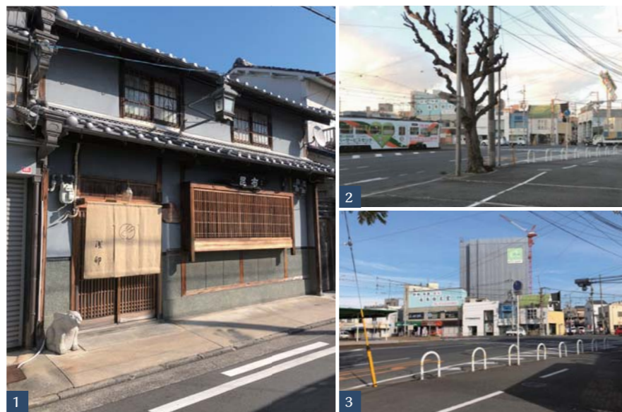
1. 堺の町家のほとんどは戦前の建物ですが、戦後でも昭和25年の建築基準法制定以前に伝統工法で建てられたものは含まれます。この町家は戦後、焼け跡から逸早く再建された、典型的なこの時期の町家です。/ 2. 2018年10月1日撮影 南からマンション予定地方向を望む / 3. 2019年12月24日撮影 建設中のマンション

今回は3日とも、地区の南エリアに足を伸ばしたので、建設中の11階建てマンションがどこからもよく見え、参加者のみなさんにも景観問題を实地に理解していただくことができました。