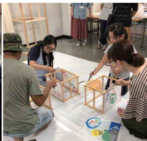
行灯の枠四面に絵を貼って完成させます。