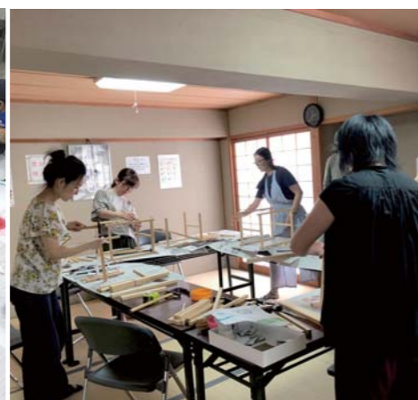
小さな行灯の枠作りが奮闘中。