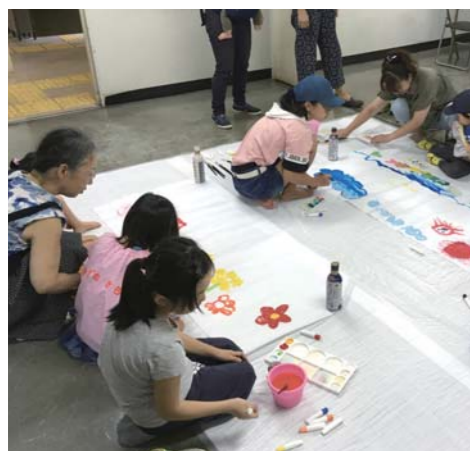
大きな行灯の絵を製作中です。