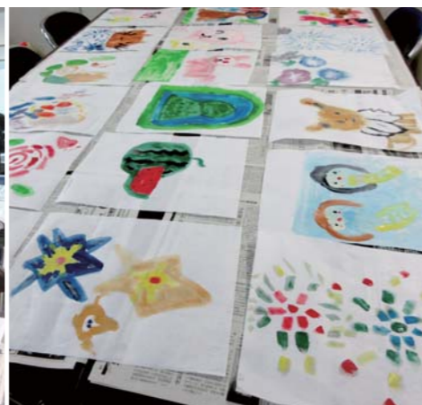
小さな行灯の絵がズラリ。