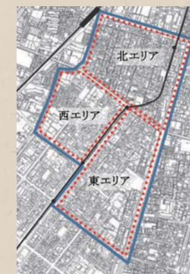
アンケート調査範囲

また、アンケートの結果を踏まえ、協議会活動に多くの方が参加してもらえるよう、周知・啓発にむけた取組みを実施していきたいと考えています。