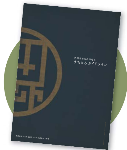
「まちなみガイドライン」冊子の表紙イメージ